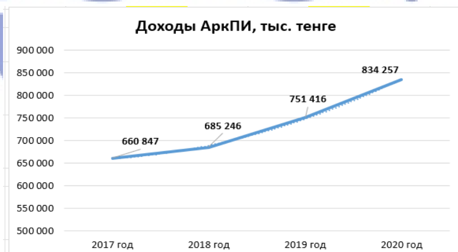
Рисунок 2 - График движения доходов АркПИ за период 2017 – 2020 гг.

Приведенные данные свидетельствуют о том, что за последние 4 года доходы АркПИ имеют тенденцию роста (рис. 2). Причем, наблюдается тенденция роста как доходов за счет государственного бюджета на 20 % за счет увеличения средних расходов за обучение и увеличение контингента обучающихся по госзаказу, так же, как и доходы за счет внебюджетных средств увеличились на 28 %.