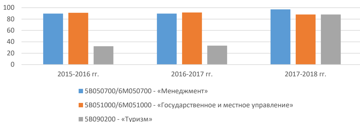
Рисунок 2 – Трудоустройство выпускников аккредитуемых ОП

В процессе анкетирования 85,4% обучающихся выразили полную удовлетворенность уровнем исполнения правил и стратегий образовательной программы, академической нагрузкой и требованиями к студенту полностью удовлетворены 82,5% респондентов, полную удовлетворенность своевременностью оценивания выразили 85,4% опрошенных.