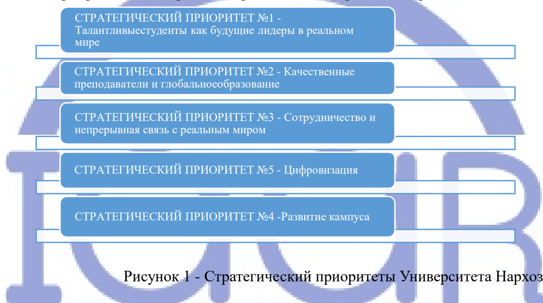
Рисунок 1 - Стратегический приоритеты Университета Нархоз

Обновленная миссия университета, отраженная в стратегическом плане, определила новые приоритетные направления развития Университета Нархоза: